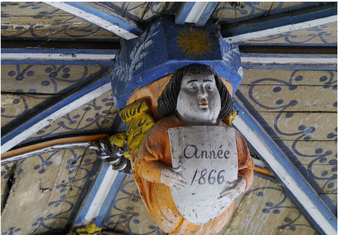
Photographie du monument historique